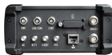
Версия: 2 антенны (арт. P90F)

Примечание. Приемник ГНСС P90 имеет разные версии внутреннего навигационного приемника, что влияет на его функциональные возможности и качественные показатели.