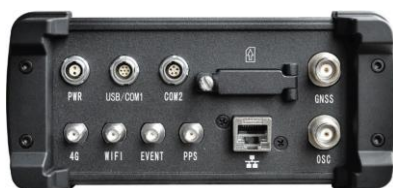
Версия: 1 антенна (арт. P90G)