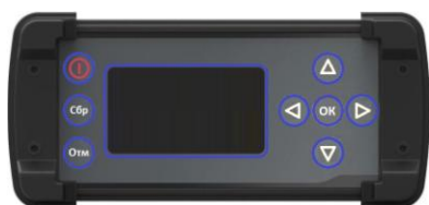
Внешний вид Приемника ГНСС P90